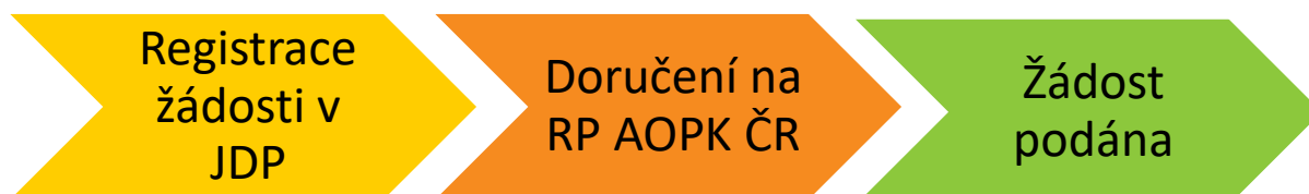
Obr. 1 – Kroky vedoucí k podání žádosti

Žadatel po registraci žádosti vygeneruje její tiskovou verzi ve formátu pdf a podepíše, čímž stvrdí čestná prohlášení a všechny skutečnosti uvedené v žádosti o dotaci. Ve lhůtě maximálně 5 pracovních dnů od registrace žádosti v JDP podepsanou tiskovou verzi žádosti (včetně všech příloh požadovaných dle kap. B.3 a příloh č. 3 a 4 této Příručky, které žadatel neuložil do JDP) doručí na AOPK ČR. Pokud je vytištěná žádost doručena osobně anebo poštou, bude žadatelem podepsána fyzicky. Žádost lze doručit i datovou schránkou (dále jen „DS“). V případě doručení žádosti e-mailem bude žádost podepsána kvalifikovaným elektronickým podpisem. Žádost je považována za podanou v momentě doručení na AOPK ČR.