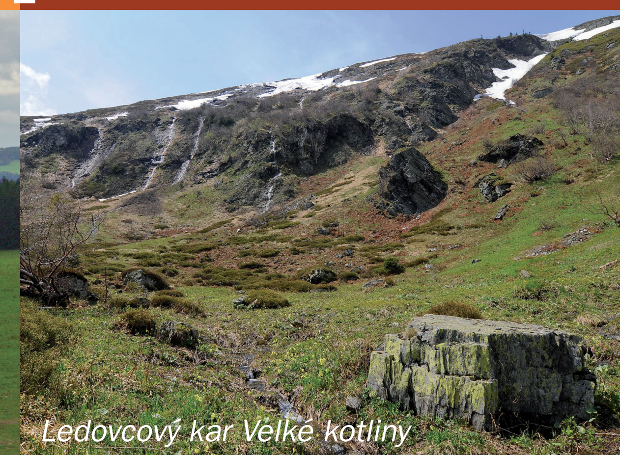
Ledovcový kar Velké kotliny

Od konce prvohor se povrch vzniklého pohoří začal postupně zarovnávat. Na konci třetihor byly v Nížkém Jeseníku aktivní sopky v jihovýchodním okolí Bruntálu (Velký a Malý Roudný, Venušina sopka, Uhlířský vrch). Jedná se o nejmladší sopky u nás. Můžeme zde spatřit zachovalé lávové proudy čedičů a mohutné usazeniny hornin ze sopečného popela, tzv. tuřů.