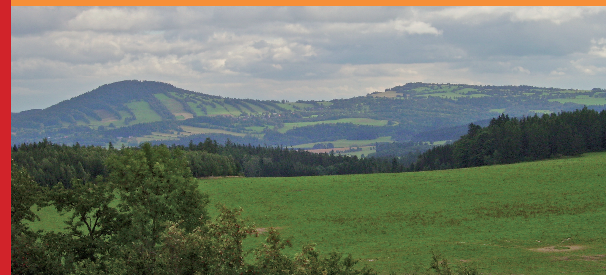
Sopky Velký (vlevo) a Malý Roudný

Ke konci horotvorných pochodů v karbonu se pohoří rozlámalo na kry, které se různě posouvaly. Podél zlomů pronikaly k povrchu hlubinné vyvěřeliny. Tak vznikl pravděpodobně žulovský pluton s převládající horninou granit v severní části Jeseníků. Do jádra desenské klenby zasahuje sobotínský amfibolitový masív, velmi podobné těleso – jesenícký amfibolitový masív – se nachází v prostoru mezi Jeseníkem a Rejvízem.