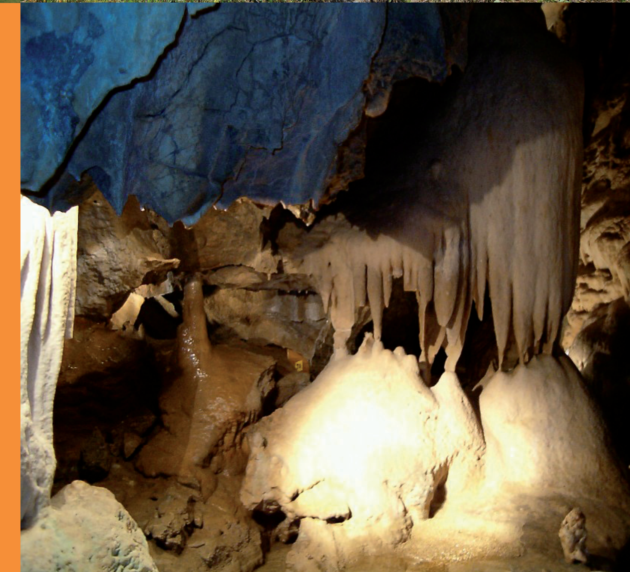
Jeskyně Na Pomezí