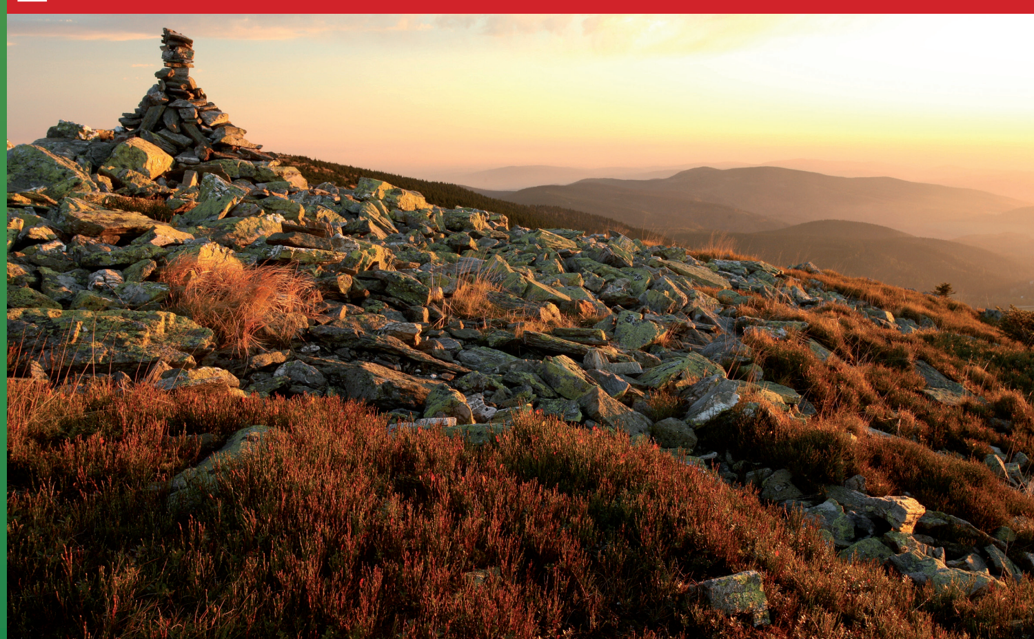
Kamenné moře na vrcholu Břidličné hory