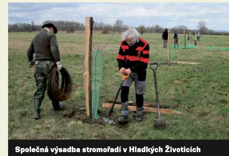
Společná výsadba stromořadí v Hladkých Živicích

Projekt Ochrana páchníka hnědého v EVL Poodří (LIFE 17 NAT/CZ/000463) je spolufinancován z programu LIFE Evropské unie a Ministerstvem životního prostředí ČR. Autor: Arnika – Centrum pro podporu občanů, 2020. Poskytovatelé dotace nejsou odpovědní za obsah materiálu. Uvedené informace vyjadřují názor autora.