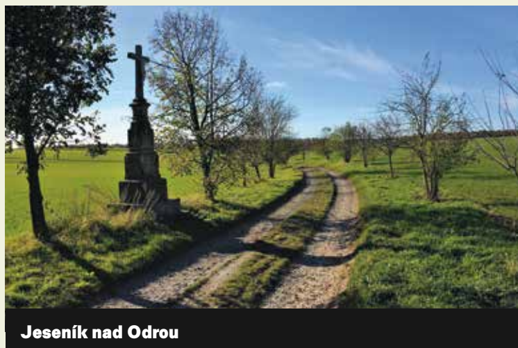
Jeseník nad Odrou