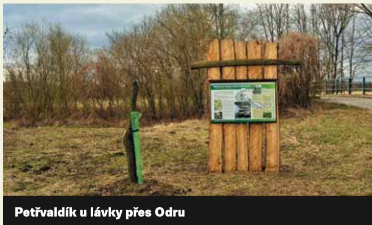
Petřvaldík u lávky přes Odru