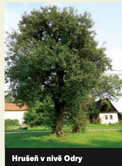
Hrušeň v nivě Odry