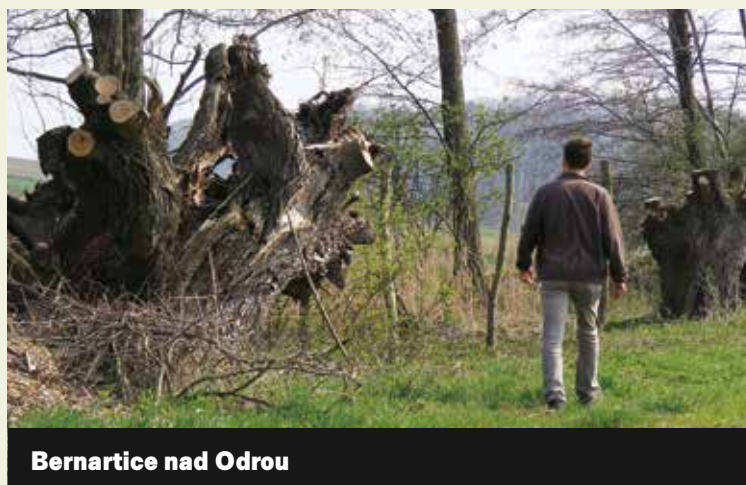
Bernartice nad Odrou