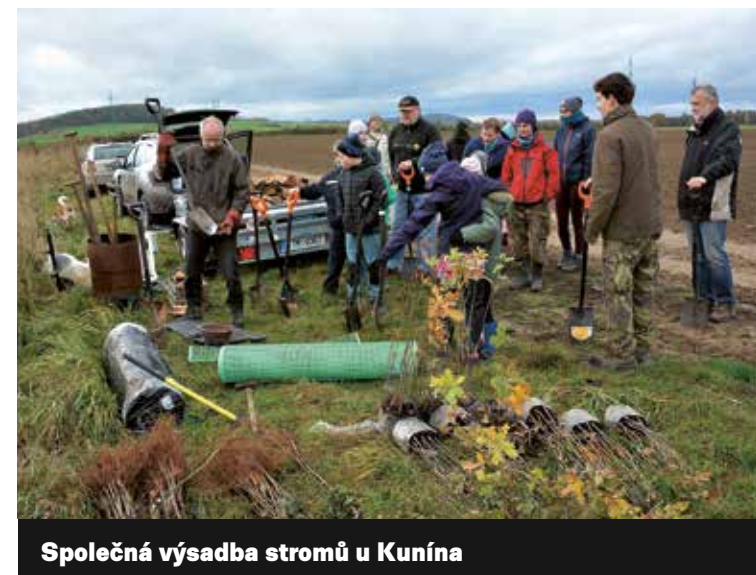
Společná výsadba stromů u Kunína

Arnika – Centrum pro podporu občanů a ZO ČSOP Studénka